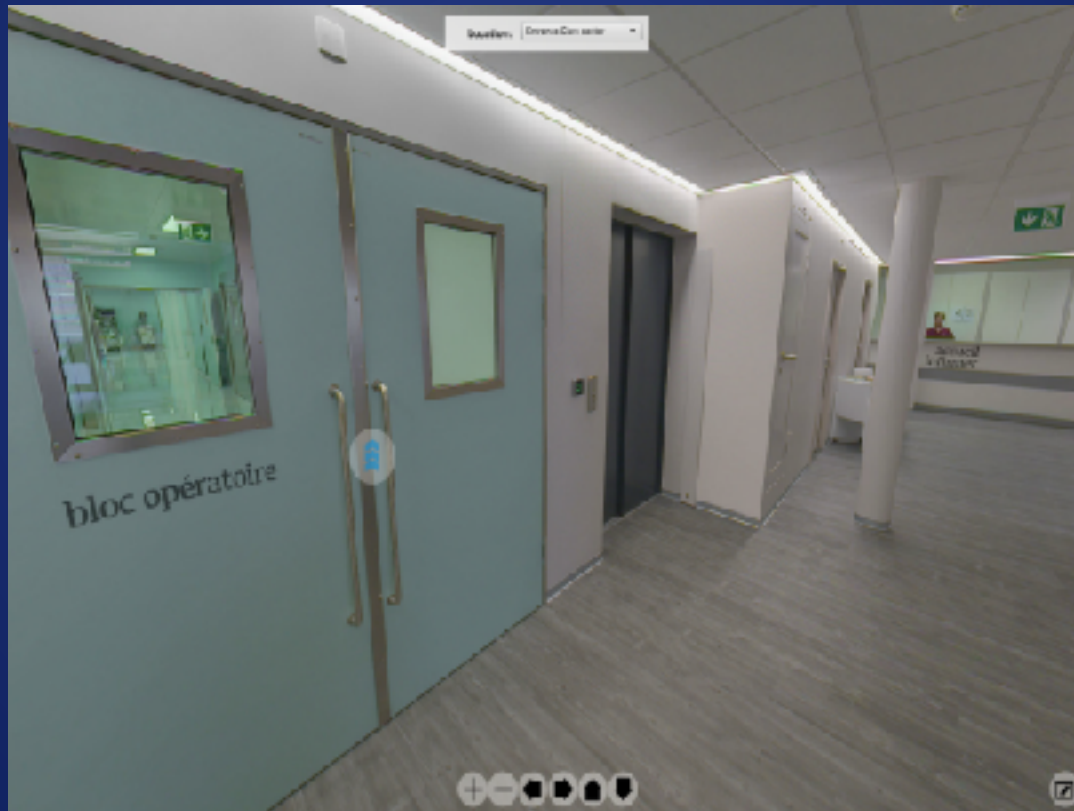
CIC Santé Chirurgie Générale